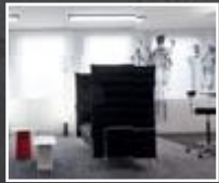
Kommunikations- bereiche Seite 22