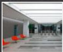
Licht für Foyer und Flur Seite 28