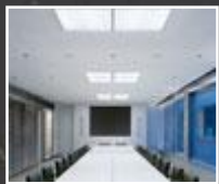
Licht für Konferenzen Seite 24