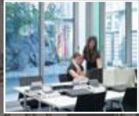
Besser arbeiten mit gutem Licht Seite 10