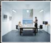
Lichtwirkung auf den Menschen Seite 16