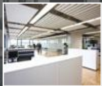
Licht am Arbeitsplatz Seite 18