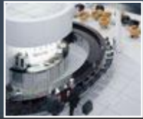
Büro im Wandel Seite 6